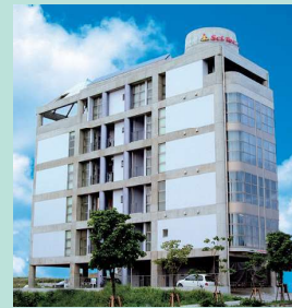
サイテックカレッジ那覇