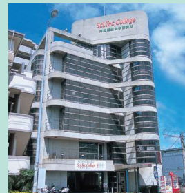
サイテックカレッジ美浜