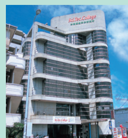
サイテクカレッジ美浜