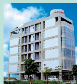
サイテクカレッジ那霸